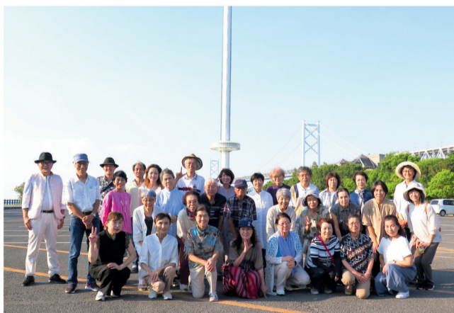
瀬戸大橋をバックに、記念撮影。夕日が美しかった。