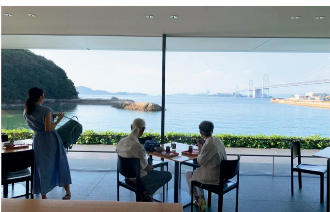
東山魁夷せとうち美術館。海を眺めつつ、くつろげる。